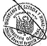
PEDRO SÁNCHEZ GAMARRA Ministro de Energía y Minas