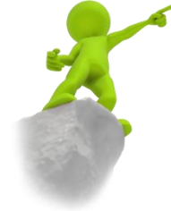
Cuadro N° 7