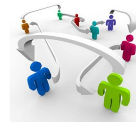
Cuadro N° 12