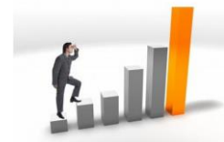
Cuadro N° 2